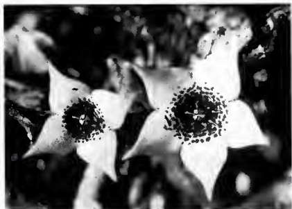
Pl. 1. — Stapelianthus keraudrenae , sp. nov. : une fleur (photo du type). — Stapelianthus arenarius , sp. nov. : deux fleurs, dont une, tétramère, aberrante (photo du type).